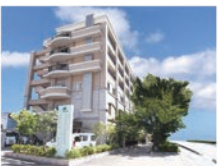
介護医療院 菜の花 〒592-0014 大阪府高石市綾園2-15-18 TEL: 072-263-6300 FAX: 072-263-6310