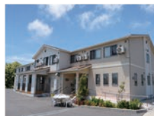
有料老人ホーム コスモスの家田尻 〒598-0091 大阪府泉南郡田尻町嘉祥寺477-1 TEL: 072-466-0601 FAX: 072-466-0576