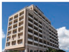
高石藤井病院 〒592-0014 大阪府高石市綾園1-14-25 TEL: 072-262-5335 FAX: 072-263-6696