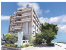
介護医療院 菜の花 〒592-0014 大阪府高石市綾園2-15-18 TEL: 072-263-6300 FAX: 072-263-6310