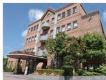
介護老人保健施設 華 〒596-0046 大阪府岸和田市藤井町2-22-20 TEL: 072-431-8791 FAX: 072-431-8705