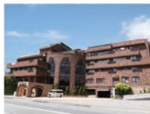
泉北藤井病院 〒590-0126 大阪府堺市南区泉田中3100-19 TEL: 072-295-8888 FAX: 072-295-8188