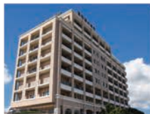
高石藤井病院 〒592-0014 大阪府高石市綾園1-14-25 TEL: 072-262-5335 FAX: 072-263-5696