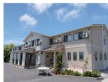
有料老人ホーム コスモスの家田尻 〒598-0091 大阪府泉南郡田尻町嘉祥寺477-1 TEL: 072-466-0601 FAX: 072-466-0576